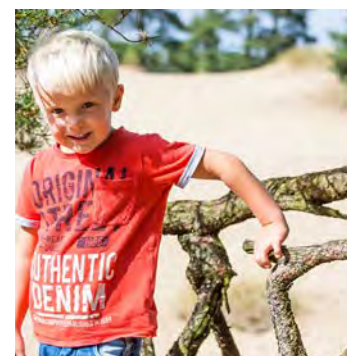
Kort og ruteanvisninger næste side!